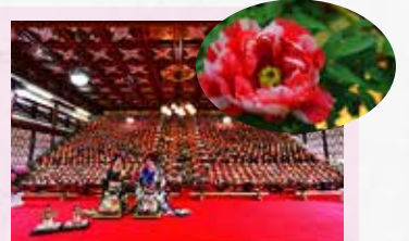
⑩ 日本最大級 32段約1,200体のおひなさま

国登録有形文化財 「瑞龍閣」の2階に32段約1,200体の おひなさまが並びます。 日本最大級のひな段は圧巻です。