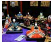
⑮⑯ 東海最大級約700体の 木目込雛の世界